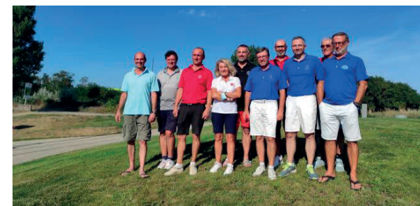
Les 4 équipes qualifiées pour participer au Championnat de France 2021 de P.&P. à Port Bourgenay